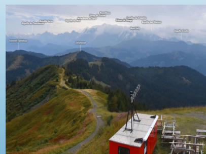
« Le fameux snack-bar « Le 1930 » » »